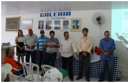
Foto 1 - Mesa de abertura