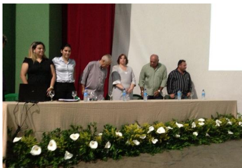
Foto 1 - Mesa de abertura

tendo em vista que todos vivem reclamando do poder público. Disse que estava triste porque esperava mais participação da população e representantes da administração pública. Propôs-se que a equipe da prefeitura reúna-se para levantar todos os dados e informações necessários para revisão do diagnóstico e enviá-los à consultoria antes do encerramento do prazo de 15 dias. As Fotos 1 a 4 mostram a Audiência Pública.