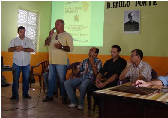
Foto 1 - Mesa de abertura