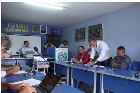
Foto 1 - Mesa de abertura

As Fotos 1 a 4 mostram a Audiência Pública.