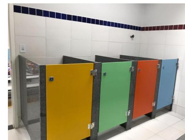
BANHEIROS ADEQUADOS ÀS CRIANÇAS