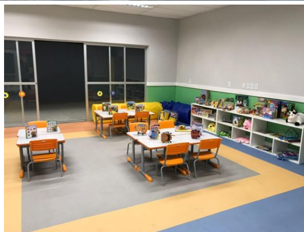
SALAS DE ATIVIDADES