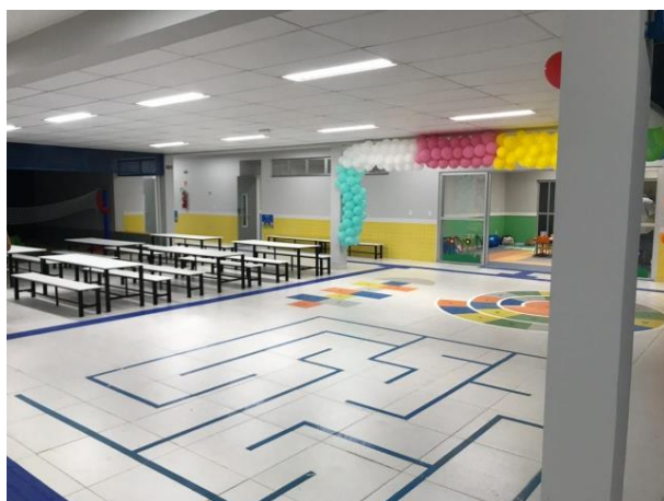
PÁTIO COBERTO / REFEITÓRIO